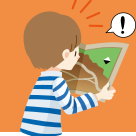
駅に設置時の地図の方向